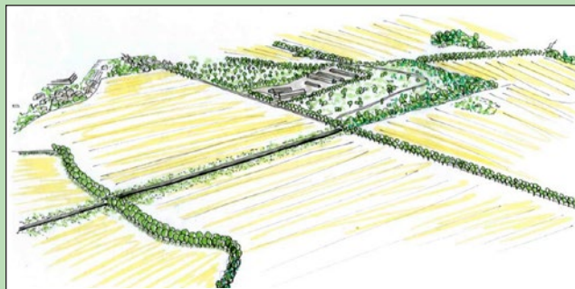
Okolí bývalého zemědělského areálu Hradisko – varianta A