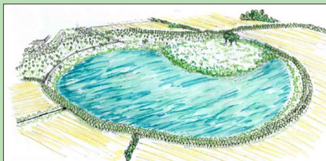
Okolí bývalého zemědělského areálu Hradisko – varianta B