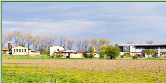
Pohled na bývalý zemědělský areál Hradisko 2016