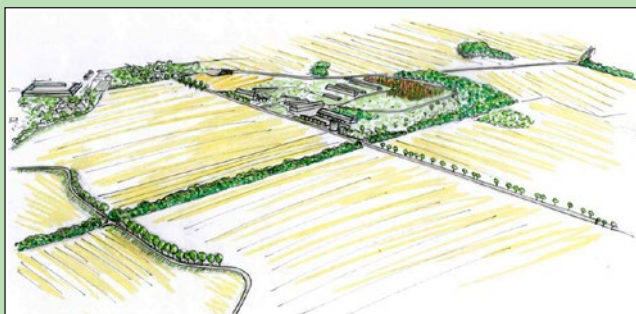
Okolí bývalého zemědělského areálu Hradisko – současný stav