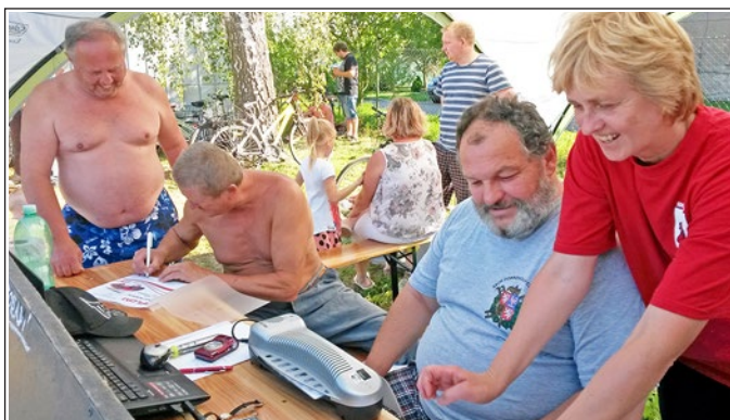
Tiskové středisko - laminování diplomů

Poslední srpnovou sobotu se ve Skrbeni už tradičně konala soutěž hasičů „veteránů“ v požárním útoku. Soutěžilo celkem devět družstev. Kromě dvou skrbeňských to byli hasiči z Břuchotína, Nasobůrek, Vísky, Ratají, Černovíra a mužské i ženské družstvo z Horky. Předvedla se také místní družstva mladých hasičů. Nejlepšího času dosáhly Nasobůrky, ale o výkony ani tak moc nešlo. Hlavním