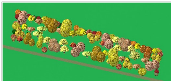
Předpokládaná podoba parčíku po dvaceti letech

Při procházce kolem železniční trati směrem k Příkazům si nelze nevšimnout bílých trubek umístěných v poli. Vyznačují pozemek, který obec získala od státu a který je určený pro výsadbu zeleně. Svým východním okrajem navazuje na hranici předpokládané budoucí zástavby. Podle připraveného projektu zde bude vysazeno více než sedmdesát stromů patnácti druhů a jedenáct druhů keřů. V letošním roce, pokud to podmínky dovolí, by byl zaset trávník. S výsadbou by se pokračovalo na jaře. Záměrem je vyzvat zájemce z řad skrbeňských občanů, děti s rodiči i další, budou-li mít zájem, aby si přišli stromy vysadit společně, vlastníma rukama.