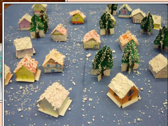
„Z vánoční výstavy ve skrbeňské škole“.