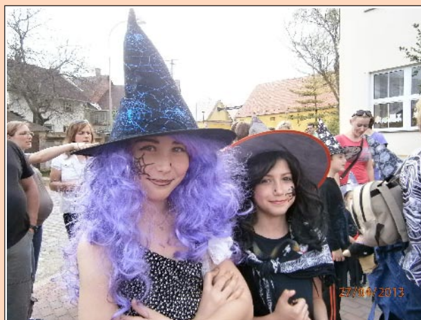
Pálení čarodějnic... (více foto na www.spss.wobo.cz )