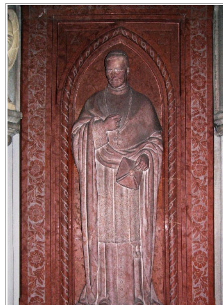
Náhrobek v katedrále svatého Václava

úřadu pražského arcibiskupa v roce 1916 vzdal, namísto toho se stal arcibiskupem olomouckým. Tento úřad vykonával do roku 1920, kdy rezignoval.