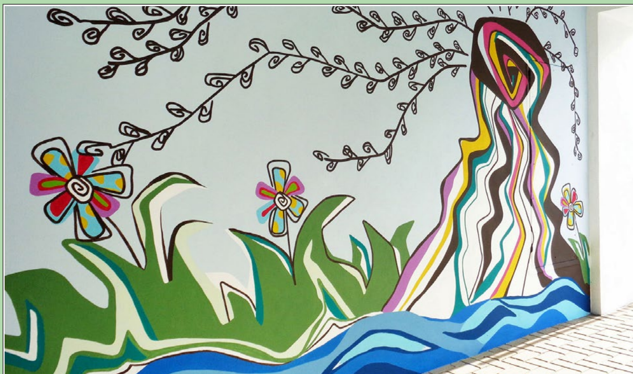
Na stěnách průchodu v Domě služeb máme nyní obrazové vyjádření názvů dvou ulic. Na snímku je „Podvrbí“, na protější stěně bude „Žabělec“ (tak se dodnes říká konci ulice Dvorské). Autorkou výtvarného návrhu je paní Martina Dražná, zhotovil Marek Navrátil (Maryska).