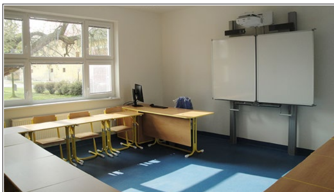
Nové prostory přístavby

Jeho nedílnou součástí je bohatý plán projektových dnů a akcí, které hodláme realizovat jak ve škole, tak ve specializovaných střediscích. Navštívíme SEV Sluňákov, Pevnost poznání, Dramacentrum v Olomouci. Pokračovat chceme i v zaběhlých celostátních projektech Školní mléko, Ovoce do škol, Les ve škole, škola v lese.