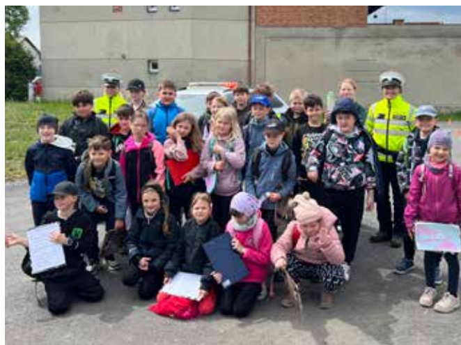
Projekt Bezpečně na silnici.

Žáci se během projektu seznamovali s cestou potravin od prvovýroby až po samotnou přípravu pokrmů a zároveň si prakticky vyzkoušeli týmovou spolupráci i základy zdravého vaření. Mimořádný úspěch zaznamenali žáci 4. ročníku, kteří připravili zeleninový salát s vlastnoručně vyrobeným sýrem. Jejich originální pokrm zaujal odbornou porotu natolik, že získal 1. místo . Stejně jako v loňském roce i letos naši žáci potvrdili své schopnosti a na slavnostech v SEV Sluňákov, vystoupali na nejvyšší příčce. Toto ocenění je pro nás potvrzením, že praktická výuka, tvořivost a spolupráce přináší krásné výsledky. Vedle kulturních a společenských akcí byl závěr školního roku bohatý také na vzdělávací a sportovní projekty.