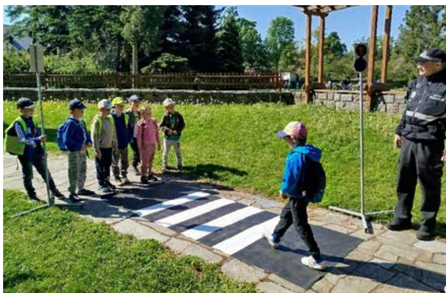
Sluníčka na dopravní soutěži