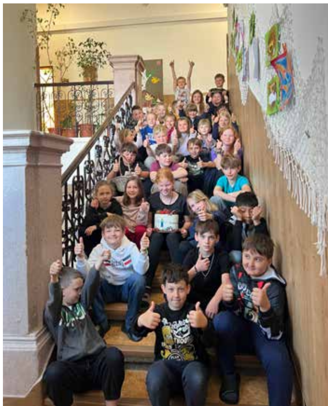
Foto s dortem - projekt Od vidlí po vidličku