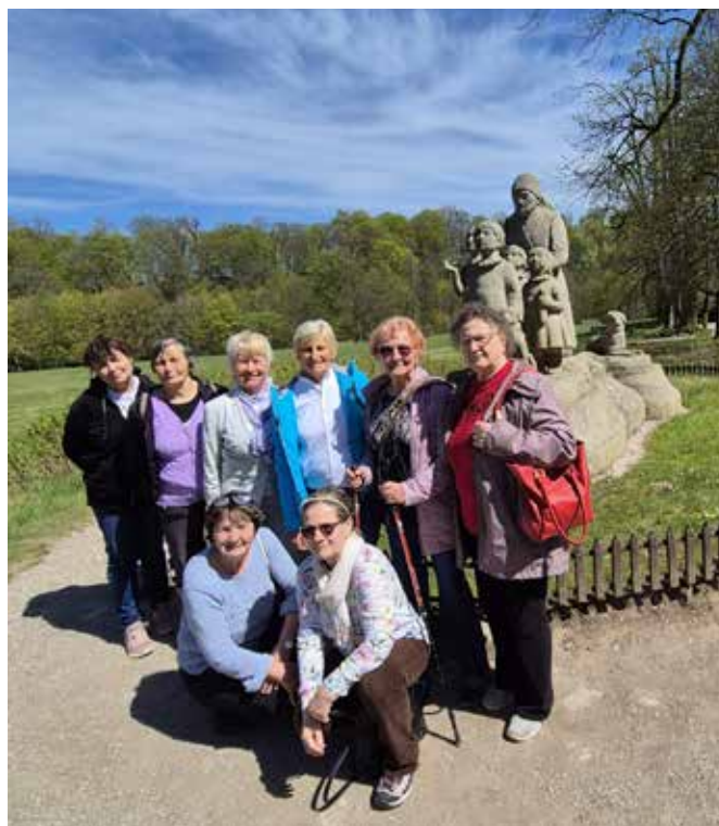
Babičino údolí v Ratibořicích

Od 2. do 9. května jsme po roce opět navštívili Luhačovice. Hned druhý den po příjezdu jsme si prohlédli hezkou výstavu k stému výročí narození Hurvinka, která potrvá až do konce roku. Doporučujeme shlédnout! Udělali jsme si vyjížďku do Pozlovic na přehradu. Ab-