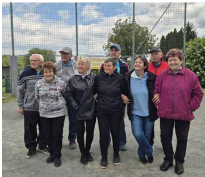
Seniorklub na soutěži v pétanque v Litovli