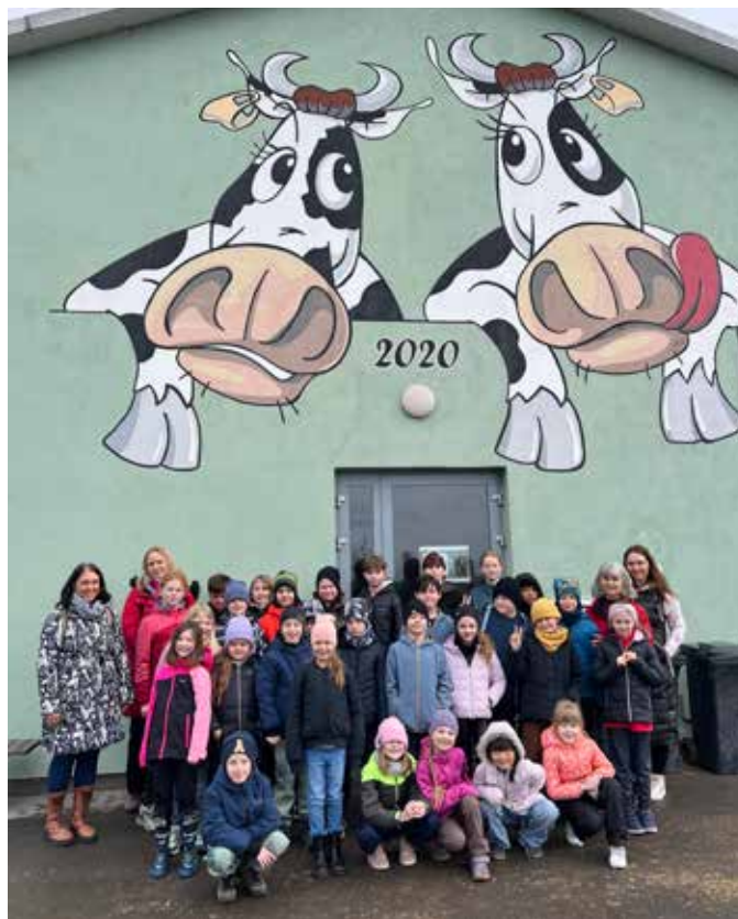
Návštěva Farma Příkazy