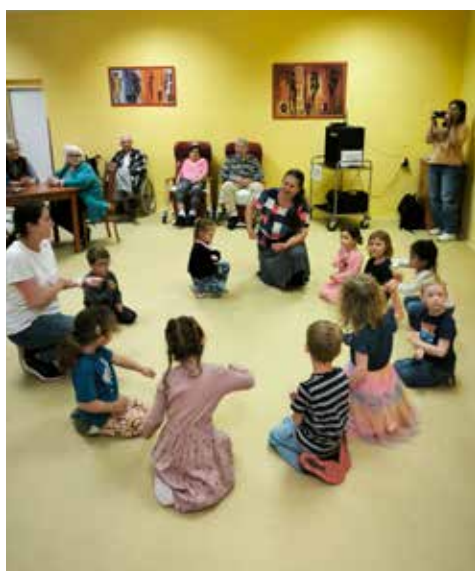
Návštěva Domova Seniorů Pohoda

Jsme rádi, že naše škola je místem, kde se přirozeně propojuje vzdělávání, tradice, bezpečnost, tvořivost i sportovní duch.