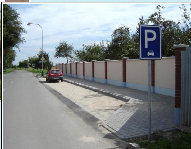
Nové parkoviště u hřbitova