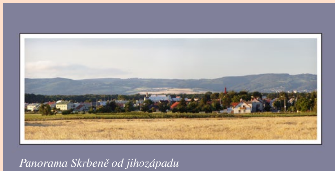
Panorama Skrbeně od jihozápadu