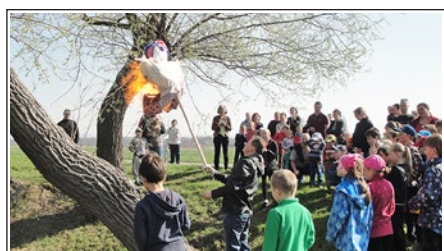
Vynášení Morany z předešlých let