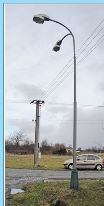
Projekt veřejného osvětlení v ulicích Nová čtvrť, U Rybníka a U Hřiště