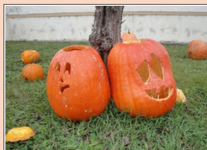
Dýně u školy