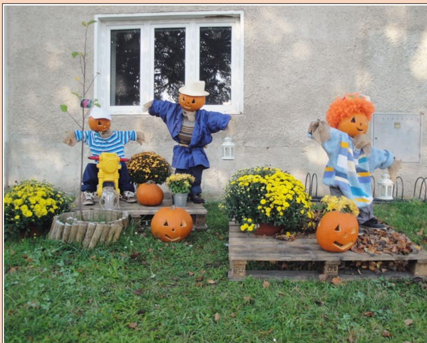
Dýně - jako nová rodina ve Skrbeni před hospodou Na statku.

Do každé domácnosti zdarma Ročník XXIX. 2019